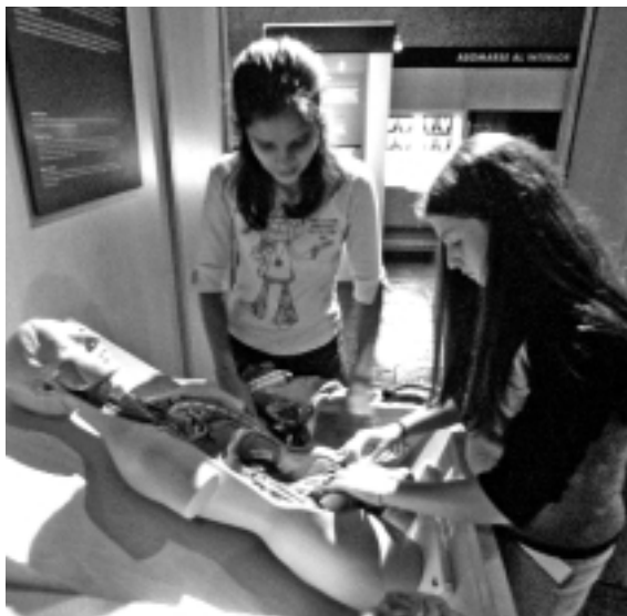
Detalle de la exposición «Anatomía: Viaje al cuerpo humano», en el Parque de las Ciencias de Granada

Durante años he visto con asombro los maravillosos astrolabios encerrados en sus vitrinas. Es lógico protegerlos, claro, pero hoy es un anacronismo insoportable